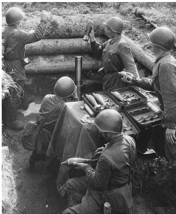
«Огонь по врагу». Карельский фронт, Кестеньгское направление. 1942 г. КГМ-60535

В октябре 1943 г. в районе озера Топозеро, р. Логоварака и севернее озера Регозеро на боевые позиции выдвинулся 8 егерский батальон финнов. В это время Ламбуш-Губа не контролировалась противником, поэтому район горы Ганкашваара им усиленно укреплялся. На левом фланге Кестеньгского «фронта» в Еletz-озеро, Сонозеро [так в документе], Шапкозеро, Манчо-Ваара [так в документе], вероятно, и в Сегозеро располагался гарнизон в составе 700 военнослужащих отдельного мотострелкового батальона Беннера. На правом фланге, вдоль дороги до Топозера, также находились финские гарнизоны. В декабре 1943 г. на Кестеньгском направлении в составе немецких подразделений СС «Норд» дополнительно дислоцировалась 17 рота 105-мм химминометов.