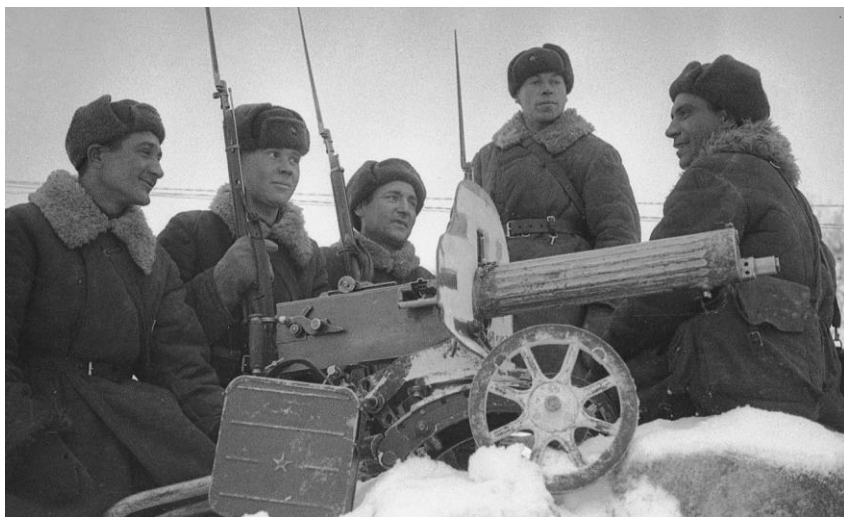
Пулеметный расчёт 186-й стрелковой дивизии в перерыве между боями изучает материальную часть. Карельский фронт, Кестеньгское направление. 1942 г. Фото С.М. Раскина. КГМ-60555

В целом коллекция солдатских медальонов с записками-вкладышами в фонде документальных источников НМРК представлена в относительно малом количестве. Тем не менее, музейное собрание продолжает пополняться. В 2011 г. из расформированного Петрозаводского гарнизонного Дома офицеров в фонды поступил медальон 1941–1942 гг. к анкете военнослужащего 40 . Кроме того, в феврале 2020 г. от И.Ю. Герасёва были приняты на постоянное хранение семь капсул и одна анкета военнослужащего РККА, обнаруженные в разные годы на территории Республики Карелия КРОФ «Эстафета Поколений» 41,42 .