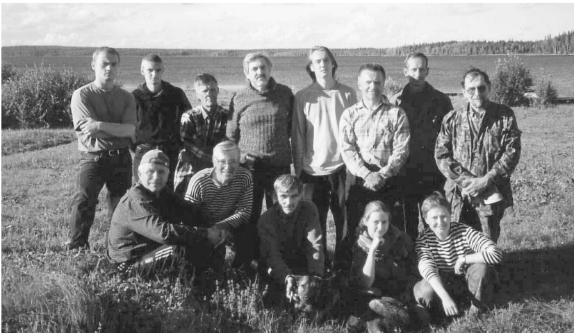
Участники НИЭ «Осударева дорога-2003». Петровский Ям. 2003 г.