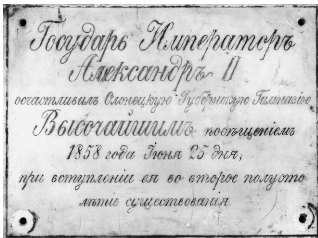
Доска о посещении императором Александром II Олонецкой губернской гимназии. КГМ 48577

Первая (45×35×2,5 см) – отмечает посещение императором Александром II Олонецкой губернской мужской гимназии с надписью: «Государь Императоръ Александръ II осчастливилъ»